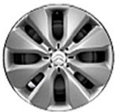
WHALETAIL Okrasný kryt 15"