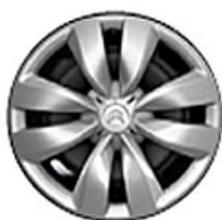
ASTERODEA Okrasný kryt 15"