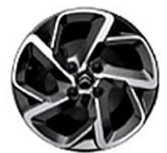
SAN DIEGO Hliníkové disky 16"