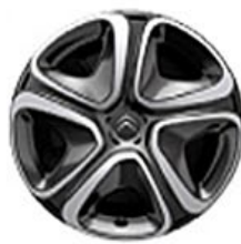
3D Okrasný kryt 16"