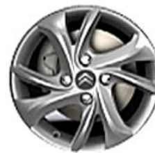
TUORLA Hliníkové disky 15"